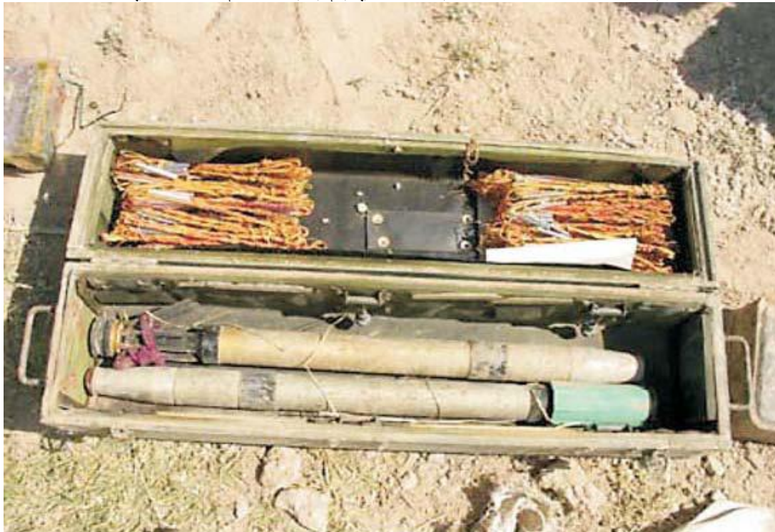
پورته عکس هغه اجناس په ډاگه کوي چې په پټنځای کې په یو صندوق کې موندل شوي چې په پورتنی عکس کې انخور شوی ده.