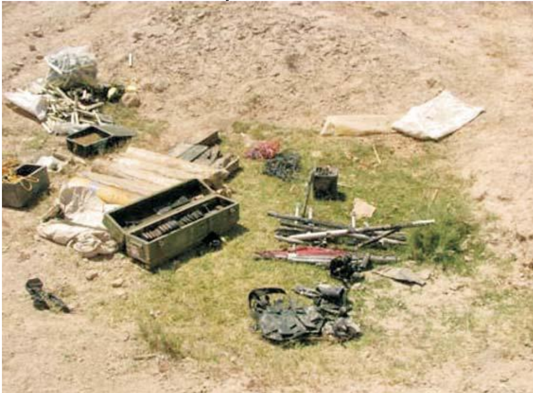
پورته عکس ټول هغه اجناس په ډاگه کوي چې په پټنځای کې موندل شوي.